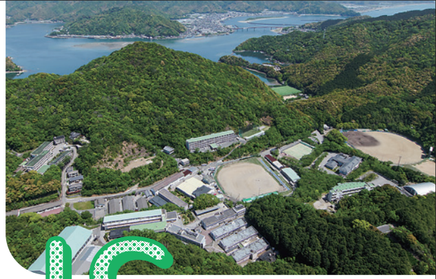
堂ノ浦キャンパス