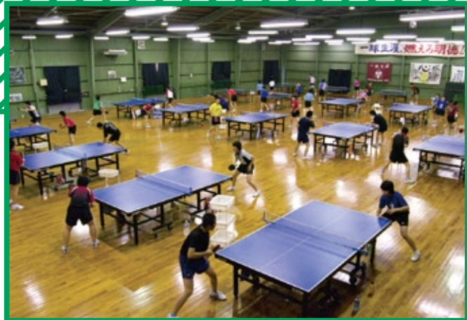
専用の「卓球道場」があり、常時19台の卓球台を設置。世界レベルを育てるフィールドです。