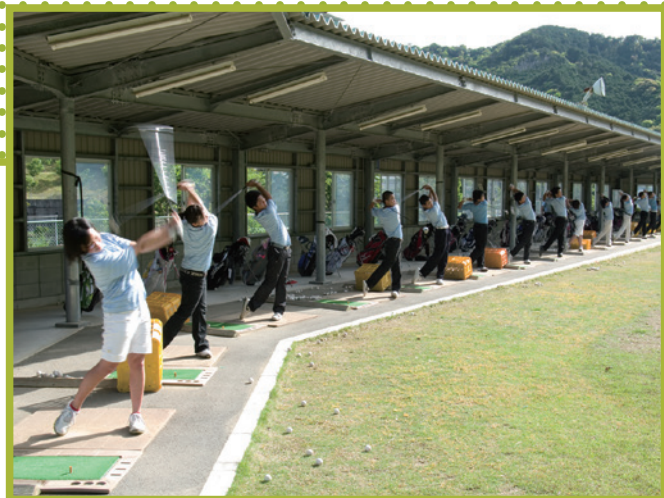
19打席30ヤードの全天候型打撃練習場